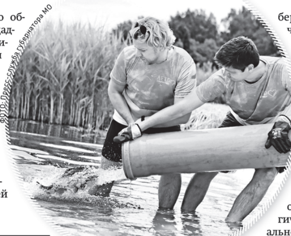
В озеро Сенеж выпустили почти две тонны карпов

В 2019 году форум стартует 5 июля, а закончит свою работу 20 августа. За шесть смен он примет более 6 тысяч участников со всей России. В данный момент завершается подготовка площадки. Лучше станут бытовые условия: жить участники «Территории смыслов» будут в домиках с удобными кроватями и кондиционерами, а не в палатках, как раньше. Оборудуют всем необходимым и саму территорию Мастерской – на-