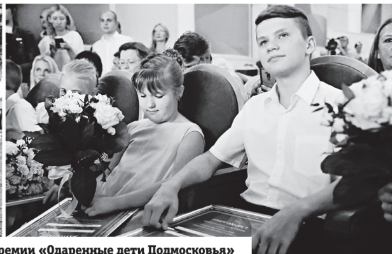
Лауреаты губернаторской премии «Одаренные дети Подмосковья»